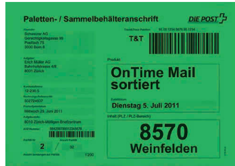
Beispiel: OnTime Mail nach Postleitzahl

– Die Beschriftung der Sammelbehälter und Paletten (Briefbehälter müssen nicht beschriftet werden) hat dieselbe Farbe (Neongrün) wie die Bundzettel bei sortierten Sendungen.