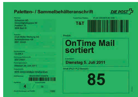
Beispiel: OnTime Mail nach Leitgebiet