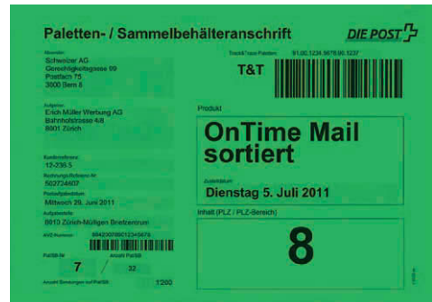
Beispiel: OnTime Mail nach Zentrum