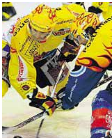
PostFinance bleibt weiterhin Sponsorin des Schweizer Eishockeys.

«Zusätzlich fördern wir das neueste Nachwuchsprojekt: die Swiss Ice Hockey Academy», ergänzt Thomas