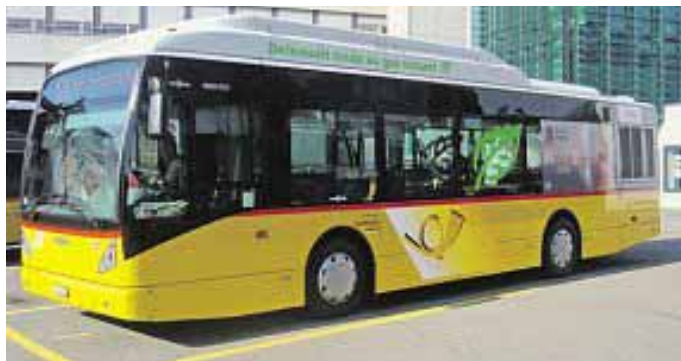
Fahrgäste und Fahrer sind zufrieden mit dem Betrieb des Gasbusses in Delsberg.

PostAuto sucht nach alternativen Techniken zum reinen Dieselantrieb. Seit vier Monaten setzt PostAuto in Delsberg einen Gasbus ein. Bis Ende März leistete er bereits ohne nennenswerte technische Probleme die ersten 10 000 Kilometer. Darum die Bilanz nach zwei Monaten: Sowohl die Besteller wie auch die Fahrgäste und PostAuto zeigen sich zufrieden. Die Stadt Delsberg setzt bewusst auf den Energieträger Erdgas und schätzt es, dass jetzt ein Postauto mit reduziertem Schad-