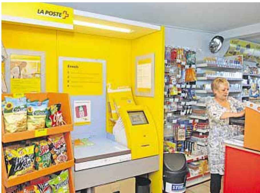
Die Agentur bietet ein Grundsortiment für den täglichen Bedarf an: Briefe, Pakete, Finanzdienstleistungen.

Text: Manuel Ackermann