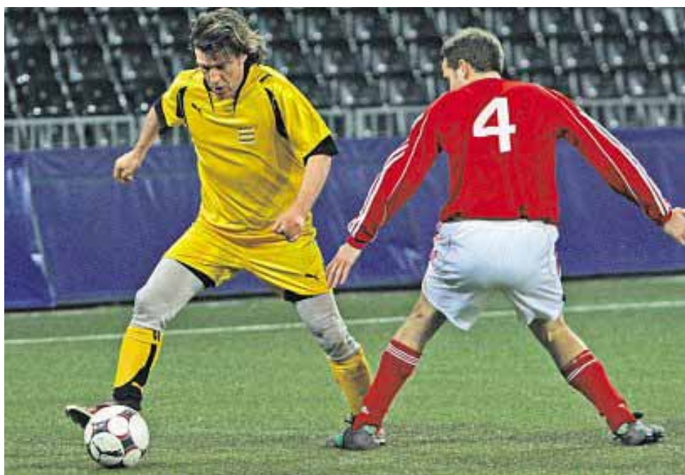
Mit geeigneter Ausrüstung, regelmässigem Fitnessstraining und Fairplay kann man Verletzungen im Fussball vermeiden.

Auch unter den Mitarbeiterinnen und Mitarbeitern der Post fordert König Fussball seinen Tribut. Auch wenn er zum Glück nicht ganz so häufig als Unfallursache genannt wird wie bei der Gesamtheit der Betriebe, die bei der Suva versichert sind. Immerhin entfallen auch in unserem Unternehmen 9,5 Prozent aller Nichtberufsunfälle auf das Freizeitsportkicken. 548 Mitarbeitende der Post haben sich im Jahr 2008 in ihrer Freizeit beim Fussballspiel verletzt. Die untere Körperhälfte ist am stärksten betroffen (379 Unfälle). Gelenkverletzungen (Fussgelenk und Knie) stehen an erster Stelle, gefolgt von Fuss-, Schienbein- und Oberschenkelverletzungen. Diese Verletzungen sind für die Betroffenen