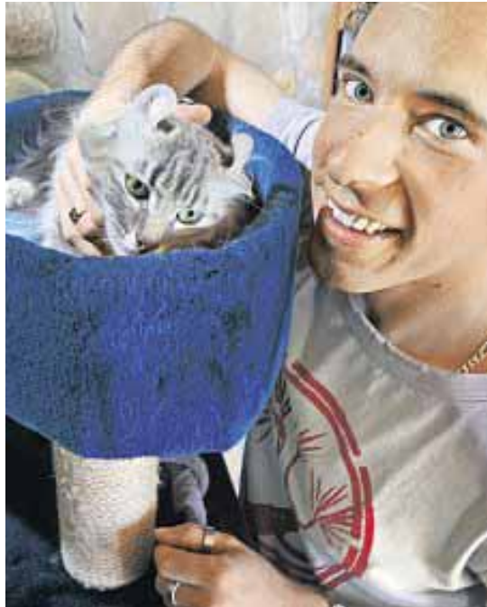
d links) und freut sich auch an seiner British Shorthair (Mitte). Seine Katzen wurden schon mehrfach ausgezeichnet.