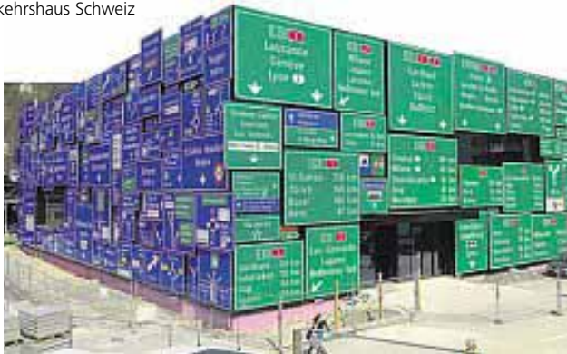
Die neue Halle Strassenverkehr ist mit über 300 Strassentafeln bestückt.

Schon von Weitem sticht sie dem Besucher ins Auge: Die urbane Fassade der neuen Halle Strassenverkehr des Verkehrshauses am Stadtrand von Luzern. Sie wurde mit 344 Strassentafeln bestückt. Aber woher stammen sie? Dazu Jasmin Trochsler, Marketingmitarbeiterin des Verkehrshauses Schweiz: «Es sind keine ausgemusterten Verkehrsschilder, sondern alles Neuproduktionen der Signal AG. Der Clou der neuen Halle: Auf der Rückseite des Gebäudes wurden die Verkehrsschilder mit dem Rücken zur Wand angebracht. So wird verhindert, dass Autofahrer von den Reflektionen der Tafeln geblendet werden.» Das Verkehrshaus hat sämtliche Gemeinden, die auf den Schildern aufgeführt sind, um finanzielle Unterstützung des Neubauprojekts gebeten. Dies im Sinne von beispielsweise einem Schweizerfranken pro Einwohner der entsprechenden Gemeinde. «Mehrere Gemeinden haben bereits zugesagt», zeigt sich Jasmin Trochsler erfreut.