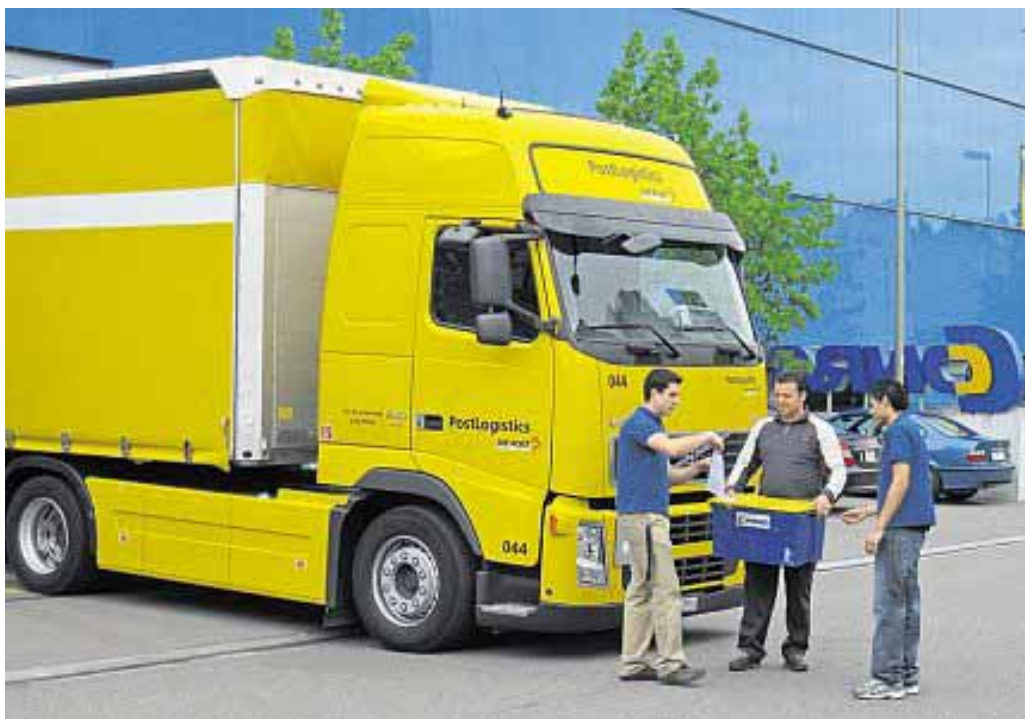
Ob Stückgut oder Pakete: Die Post sorgt in der Schweiz für den Warennachschub an die Filialen der Conrad Electronic AG.