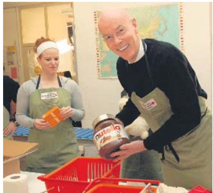
Freiwillige Helferinnen und Helfer packten dieses Jahr über 86 500 Pakete aus, die von der Bevölkerung per Post an das Schweizerische Rote Kreuz gesandt wurden.

Die Paketflut ist der krönende Abschluss eines besonderen Jahres für 2 x Weihnachten. Die gemeinnützige Aktion, die vom SRK, der SRG SSR idée suisse und der Schweizerischen Post getragen wird, findet zum zehnten Mal statt. Am Anfang stand eine einfache, aber