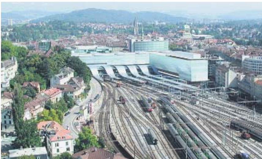
Die Schanzenpost in Bern: Als künftige Nutzungen stehen Büros, Schulen und Läden im Vordergrund.

Die Gebäudekomplexe weisen ein feingliedriges Netz von Zwischenverbindungen auf und können problemlos in mehrere selbstständige Einheiten aufgeteilt werden. Entlang des Längsbau sind vier Lichthöfe geplant, um auch das Innere mit Tageslicht zu versorgen. Mit den beiden Neubauten soll ein verbindender Stadtteil entstehen, der einen wichtigen Beitrag zur Stadtentwicklung leistet. (mw)