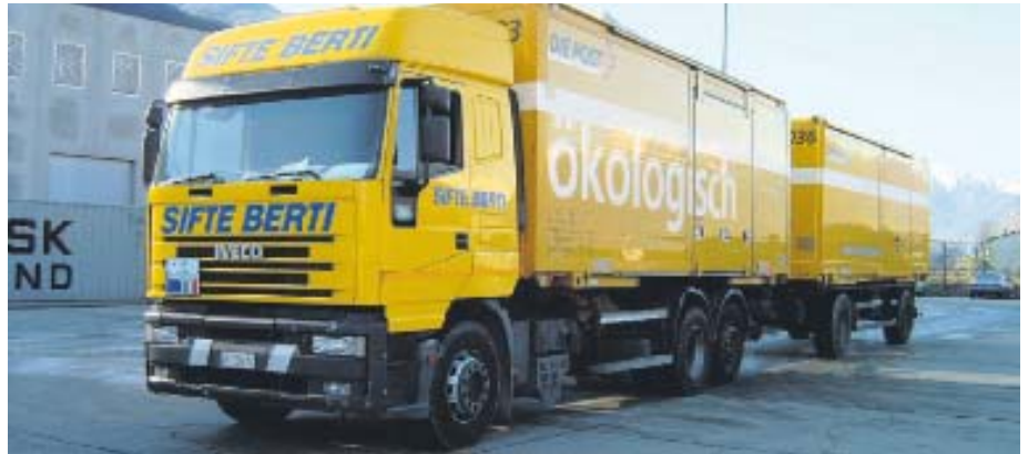
Die italienische Sifte Berti SpA ist für PostLogistics im grenzüberschreitenden Verkehr CH-Italien tätig.

PostLogistics baut ihr Dienstleistungsangebot für Stückgut, Teil- und Ganzladungen aus. Neu bietet sie grenzüberschreitende Logistiklösungen mit ihrem italienischen Partner Sifte Berti an. Jeder Partner übernimmt in seinem Heimatland den Transport und die Distribution. Die Logistikkosten sind mit einem einfachen Stückgut-Zonenpreis-Modell Italien-Schweiz, Schweiz-Italien schnell ersichtlich.