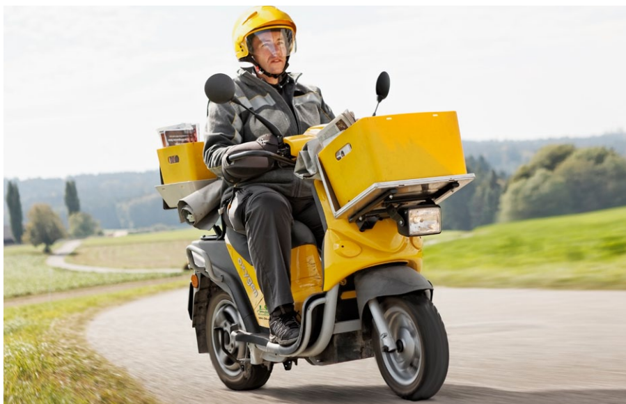
Schon bald werden 4000 zusätzliche Elektroroller für die Schweizerische Post im Einsatz sein

Mit rund 1400 Elektrorollern und 550 Elektrodreiradrollern hat die Post bereits heute die grösste Elektrorollerflotte Europas und baut diese weiter aus: Bis Ende 2012 werden 4000 zusätzliche elektrische Zwei- und Dreiradroller zum Einsatz kommen. Dies entspricht mehr