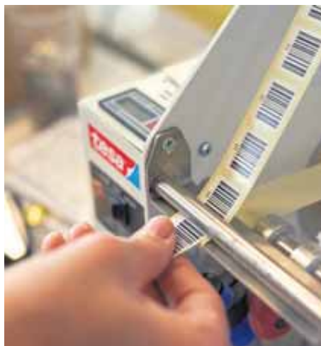
Barcodes zur Bezeichnung der Dokumente.

Danach erfolgt die Datenerkennung mit OCR (Optical Character Recognition): Dabei identifiziert die Software wichtige Daten wie Schadensart, Schadennummer oder Referenzen des Bearbeitungsteams. Basis für den Abgleich sind Stammdaten, die die Suva täglich liefert. So werden 70 Prozent der Dokumente vollautomatisch klassifiziert, 30 Prozent landen in einem der Logistik-Postkörbe, die von Mitarbeitenden der Suva bearbeitet werden. Zu guter Letzt werden die Daten via FTP-Server an die Suva übermittelt. Zwei Wochen später werden sie gelöscht; 60 Tage später landet auch die physische Post im Schredder.