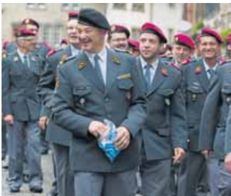
Aktive und ehemalige Feldpöstler beim Umzug.

Beim Umzug durch Murten's Altstadt, an dem sich unter anderem auch die Genfer Grenadiere in historischen Uniformen präsentierten, bestaunten die Schaulustigen etwa den letzten erhaltenen Feldpostbureauwagen mit Jahrgang 1903 und zwei mit Postsäcken beladene Maultiere. Weitere Attraktionen rund um das 125-Jahr-Jubiläum waren die Ausstellung zur Geschichte der Feldpost und verschiedene Wettkämpfe anlässlich der gleichzeitig stattfindenden Tagung des Feldpost-Verbands. ■