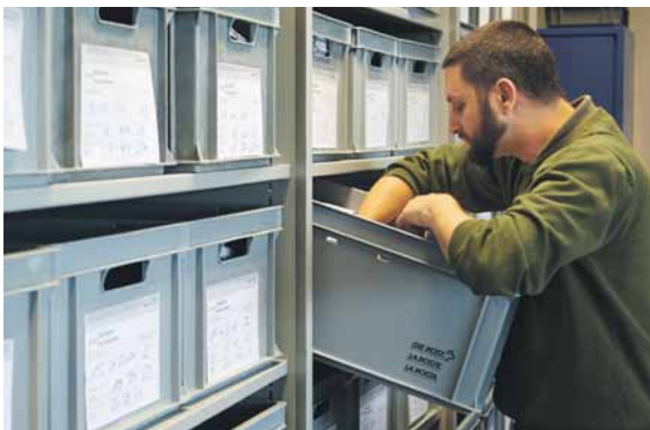
Zwei Wochen nach Lieferung der Daten werden diese gelöscht. Die physische Post wird während 60 Tagen in Kriens aufbewahrt.

Die Suva ist eine anspruchsvolle Kundin, die immer wieder neue Anforderungen formuliert. Aus diesem Grund wird das System auch kontinuierlich weiterentwickelt. Am Hauptsitz beispielsweise kommen seit einem Jahr laufend