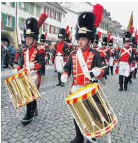
Historische Genfer Grenadier-Delegation.

Text: Marcel Marti