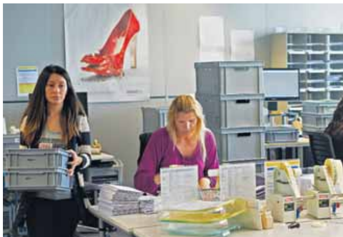
Das Suva-Team bei SPS leistet täglich erstklassige Arbeit.