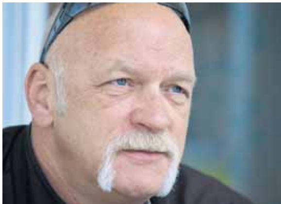
Er wurde auch schon mit US-Wrestler Hulk Hogan verwechselt.

Text: Simone Hubacher