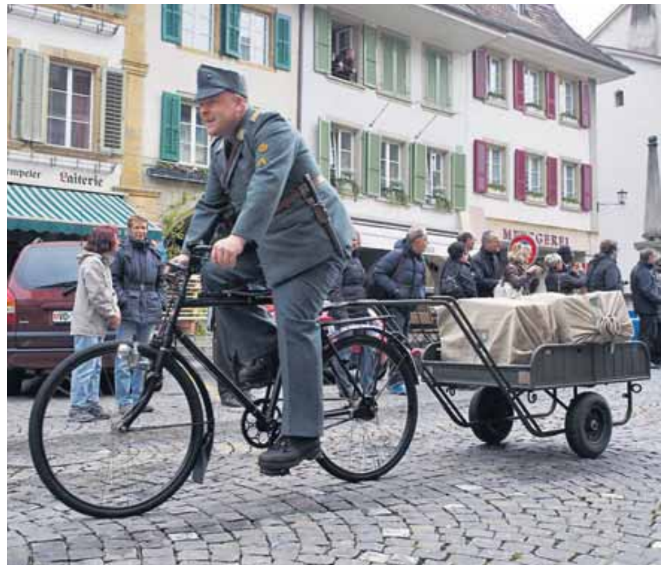
Seit 1940 im Dienst der Feldpost: das Fahrrad für Nachschub.