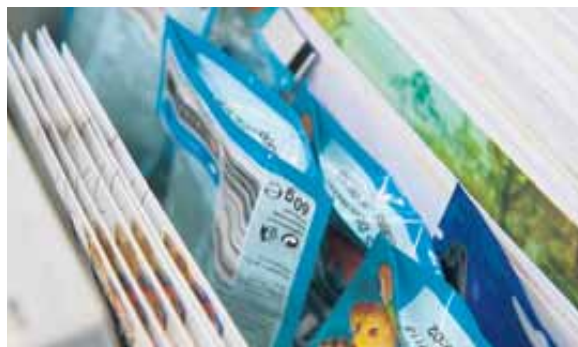
Zwischen den Briefen sind die Crackers mit den Meeresfrüchten.