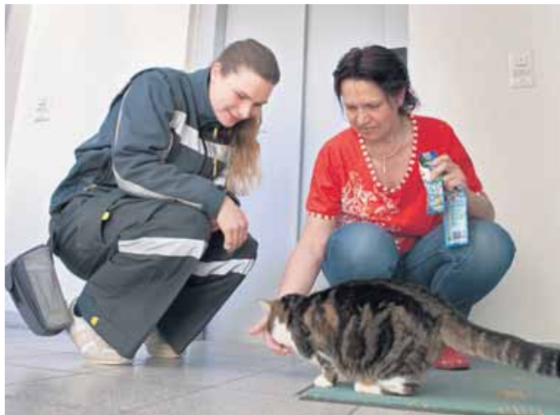
Die Katze degustiert die feinen Crackers gleich vor der Haustüre.