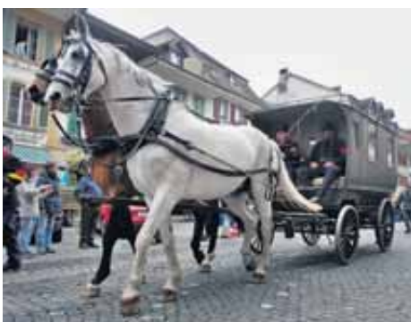
Feldpostbureauwagen Jahrgang 1903.