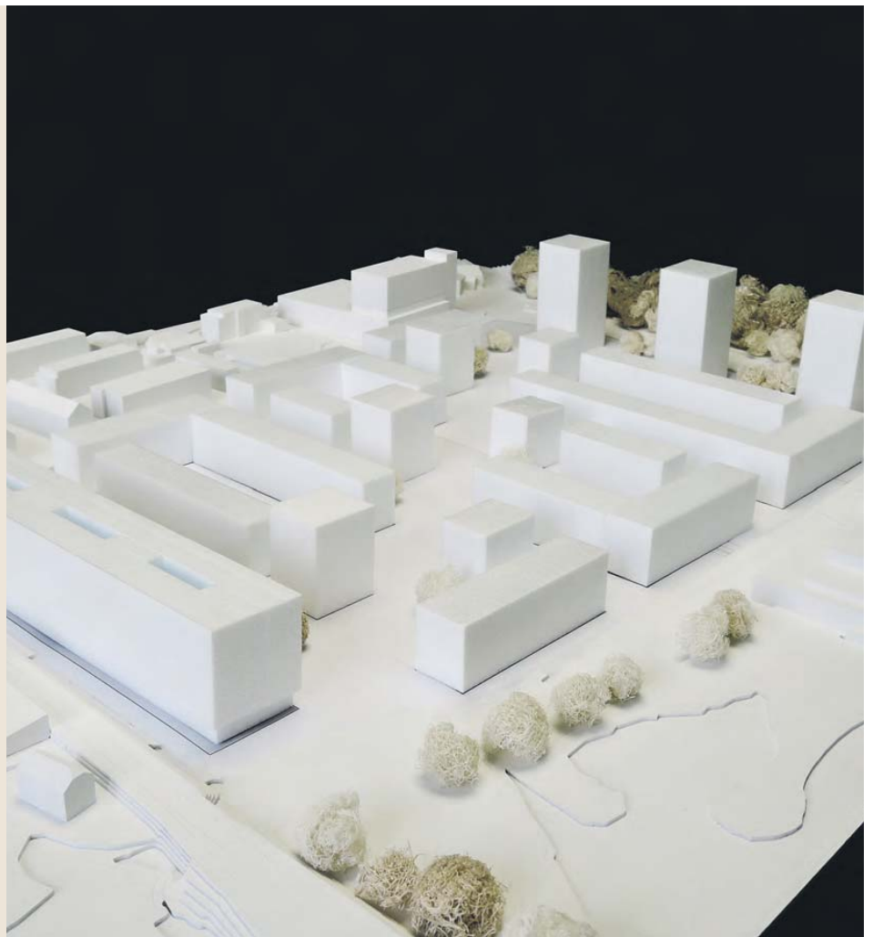
Auf diesen 37 000 Quadratmetern im Westen von Bern wird bis Ende 2024 Grosses entstehen.

Post Immobilien besitzt im Weyermannshaus West (heutiger Standort der Mobility Solutions AG) in Bern eine 37 000 Quadratmeter grosse Parzelle. Da sich in unmittelbarer Umgebung hauptsächlich Wohn- und Geschäfts- sowie Freizeitzone befinden, ist die aktuelle Nutzung nicht mehr adäquat. Die Stadt und der Kanton Bern wollen zusammen mit der Post und der Burgergemeinde Bern (Besitzerin der angrenzenden Parzelle) das Quartier zu einem modernen Stadtteil umbauen. So soll Platz für Arbeits- und Freizeitnutzungen sowie zusätzlicher Wohnraum entstehen. Dafür wird eine Umzonung der heutigen Industrie- und Gewerbezone nötig. Post Immobilien hat zusammen mit der Burgergemeinde Bern 2015 eine Potenzial- und Machbarkeitsstudie erstellt. Fazit: Bis 2025 sollen rund 275 Millionen Franken in die Entwicklung des «Post-Areals» investiert werden. Ende 2016 wurde die Planungsvereinbarung mit der Burgergemeinde und der Stadt Bern unterzeichnet. Der für die Zonenänderung erforderliche Studienauftrag wird Anfang 2017 gestartet. Mit einer rechtsgültigen Zonenänderung kann bis ca. Anfang 2021 gerechnet werden. Die weiteren Planungsschritte (Vorprojekt, Bauprojekt und Baueingabe) erfolgen zwischen 2020 bis 2022. Von Mitte 2022 bis Ende 2024 wird, sofern keine Einsprachen erfolgen, gebaut. Die Inbetriebnahme ist für 2025 geplant.