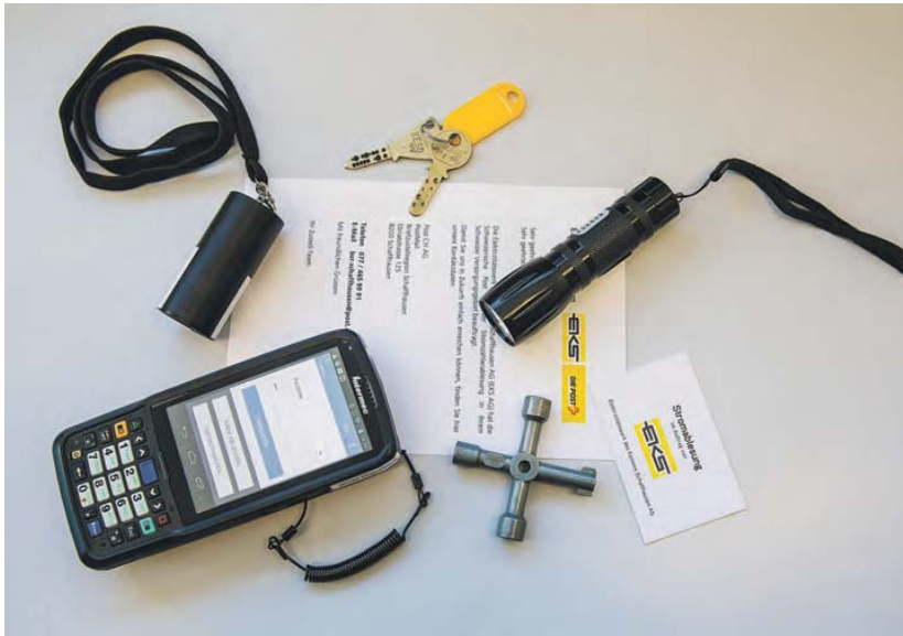
Das fürs Ablesen benötigte Material: Scanner, Taschenlampe, Bluetooth-Ablesekopf, Vierkantschlüssel, 5000er-Schlüssel und P14, Schreiben und Ausweis