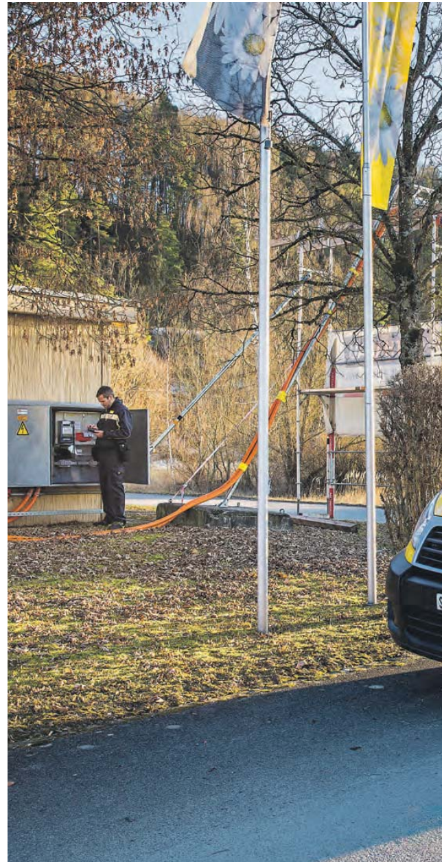
Die Postboten von Schaffhausen nehmen in diesen Wochen 30 000 Ablesungen