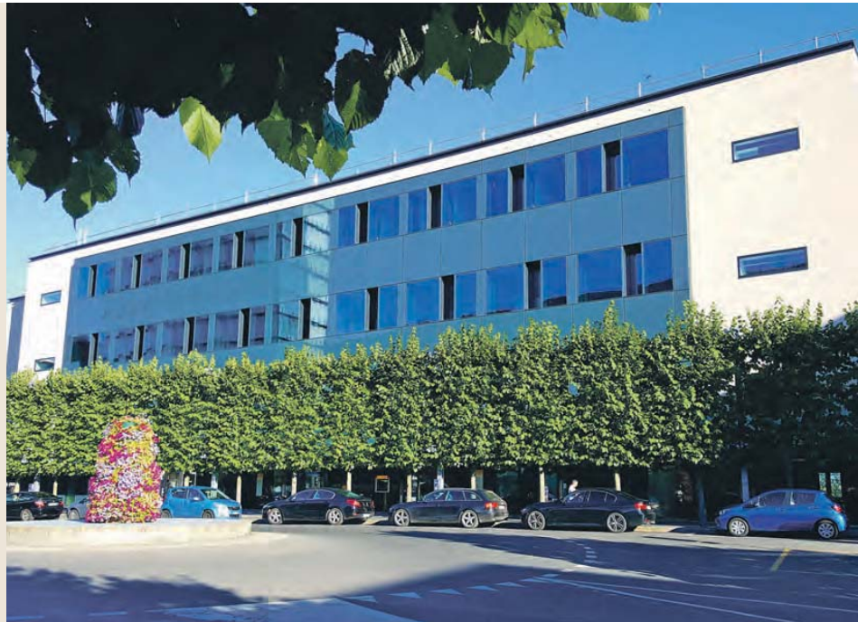
Das richtige Produkt zur rechten Zeit: Bei kleinen Entwicklungen wie Neuenburg ist das die grosse Herausforderung.

Seit Ende September 2016 erstrahlt die Liegenschaft Neuchâtel 2 Gare in neuem Glanz. Post Immobilien hat das Gebäude aus dem Jahr 1962 (letztmals renoviert 1980) für knapp 9 Millionen Franken umfassend saniert. Eine neue Gebäudehülle, die dem Minergiestandard entspricht, der Ersatz der bestehenden Heizung und die komplette Sanierung der sanitären Anlagen ermöglichen die Einsparung von über zwei Drittel der CO 2 -Emissionen (65 Tonnen jährlich). Zudem wurde auf dem Dach eine Fotovoltaikanlage installiert, die ab März 2017 Strom für die Versorgung von 17 Haushalten produzieren wird. Alle Flächen wurden vor Ende der zweijährigen Umbauzeit vermietet, und der Anteil Drittmietler konnte erhöht werden. Durch den Umbau werden rund 200 000 Franken Mehrmiete jährlich generiert, und der Wert der Liegenschaft hat sich fast verdoppelt.