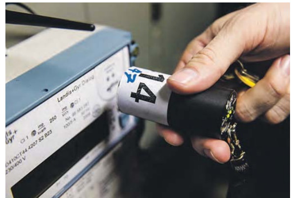
Die neueste Zählergeneration: Der Bluetooth-Ablesekopf muss nur ans Gerät gehalten werden, schon überträgt sich der Wert.