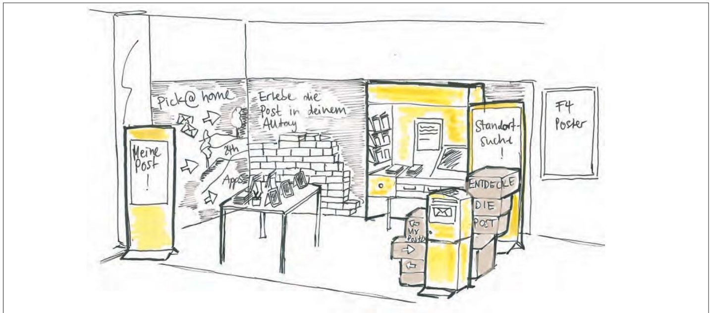
Der Showroom in den Poststellen

Wie können die vielfältigen Zugangsmöglichkeiten der Post bekannter gemacht werden? Darüber zerbrach sich die Post in den letzten Monaten den Kopf. Als Lösung lancierte sie mehrere Pilotprojekte. Eines davon, der «Showroom in den Poststellen», wurde Mitte November mit den Poststellen Bern PostParc, Zürich Sihlpost und Fribourg 1 dépôt gestartet, um zu testen, wie die neuen Zugangsmöglichkeiten bei der Bevölkerung ankommen. Unter dem Motto «Erlebe die Post in deinem Alltag» soll der mobile Showroom das Interesse der Kundschaft für die alternativen Zugangsmöglichkeiten wecken und ihre diesbezügliche Skepsis abbauen. «Mit dem Pilotprojekt wollen wir herausfinden, ob wir die Akzeptanz und Nutzung der verschiedenen Zugangsmöglichkeiten dadurch steigern können, indem wir sie den Kunden persönlich zeigen», erklärt Silvia Beyeler, Leiterin CEM und Marktforschung bei Poststellen und Verkauf. Ziel ist es, dass sich die Kundinnen und Kunden mit den My Post 24-Automaten und dem Agenturmodul, aber auch mit anderen Dienstleistungen wie z. B. PickPost, pick@home, Post-App, PostCardCreator, usw. sowie dem Login über www.post.ch vertraut machen.