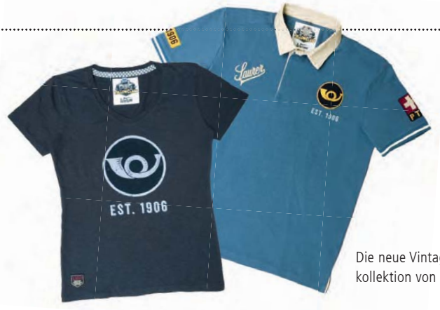
Die neue Vintage-Kleiderkollektion von PostAuto.