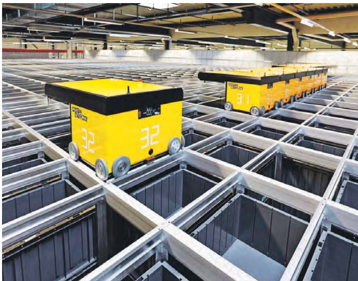
Die intelligenten Logistikroboter auf Rädern sind das Herzstück von YellowCube.

Du hast dich sicher auch schon gefragt, wie YellowCube der Post funktioniert! Die intelligenten und flinken Logistikroboter auf Rädern sind das Herzstück der hoch automatisierten Lager- und Kommissionierungsanlage in Oftringen. Und sie sind ganz schön praktisch. Denn mit dieser Hightechanlage übernimmt die Post für Onlinehändler die gesamte Palette an Dienstleistungen: Von der Lagerung über die Bestellung bis zur Auslieferung der Waren sowie dem Retourenmanagement.