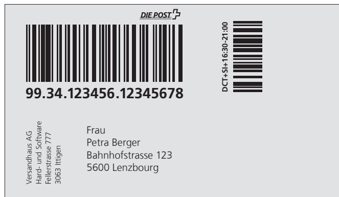
Exemple d'étiquette d'envoi DIRECT avec les prestations complémentaires Signature et Distribution 16h30-21h00

Les lieux de dépôt sont listés au point 3.5.