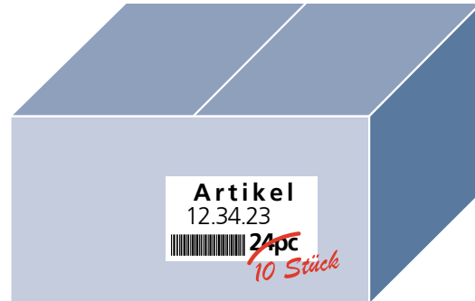
Kennzeichnung nicht artikelreiner Umpackeinheiten