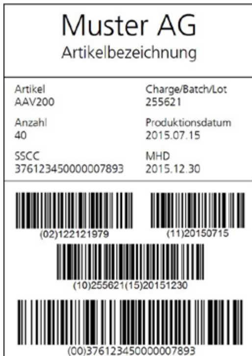
Beispiel für ein SSCC-Label

Die Kennzeichnung der verschiedenen Verpackungsstufen erfolgt nach GS1-Standards, einsehbar unter: https://shop.gs1.ch/abavimage/195/146/Logistiklabel.pdf?xet=1528986676019