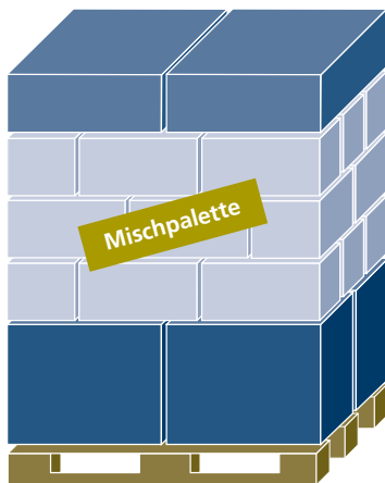
Scritta «Pallet misto»

La superficie della base degli europallet non deve essere superata. La merce o l'imballaggio non deve fuoriuscire dal bordo del pallet.