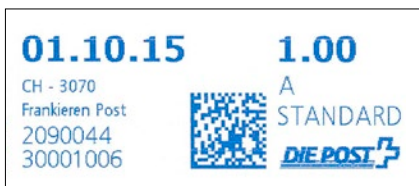
Beispiel: Aufdruck Dienstleistung Frankieren Post

Die Dienstleistung Frankieren Post setzt in Ihrem Unternehmen personelle Kapazitäten frei, die Sie beispielsweise für ertragswirksame Aufgaben einsetzen können.