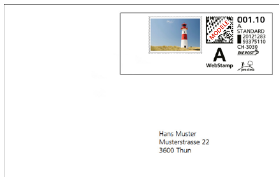
Illustration 1 + 2: Ce WebStamp présentant l'ID d'affranchissement 93375110 a été utilisé à deux reprises pour différents envois alors qu'il n'a été payé qu'une seule fois.