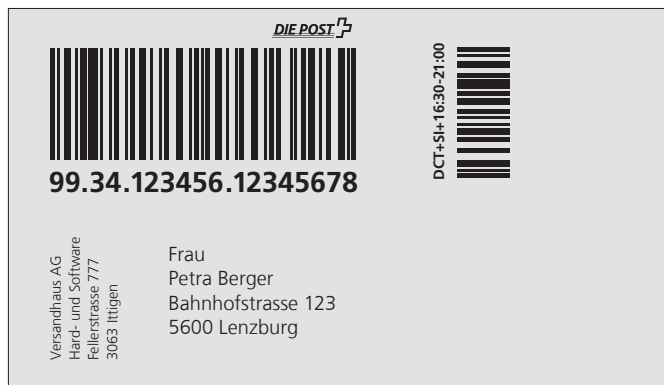
Beispiel einer DIRECT-Versandetikette mit den Zusatzleistungen Signature und Zustellung 16:30–21:00

Die möglichen Aufgabeorte finden Sie unter Punkt 3.5.