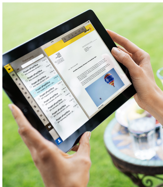
Greifen Sie jederzeit und überall auf Ihre Post zu.

E-Post Office bietet Ihnen im Abo einen kostenpflichtigen Scan-Service an, bei dem die Post Ihre Sendungen automatisch einscannet und in E-Post Office zur Einsicht, Bearbeitung und Archivierung zur Verfügung stellt.