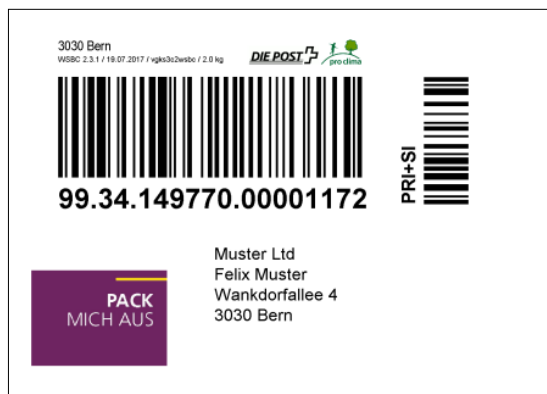
Beispiel Absenderadresse mit Logo (verkleinert)