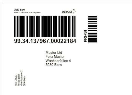
Exemple d'une étiquette conforme aux normes de la Poste avec prestations de base et prestations complémentaires (réduite)