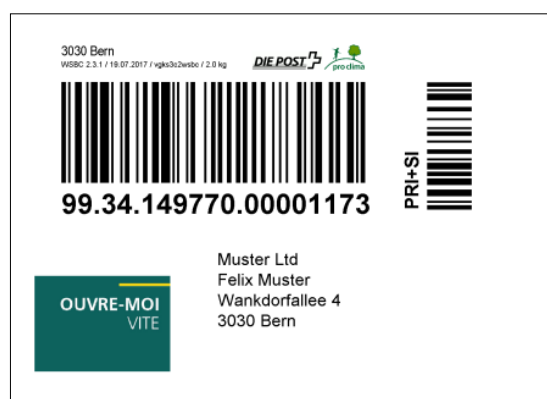
Exemple d'adresse d'expéditeur avec logo (réduit)