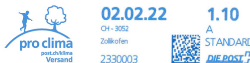
Beispiel: Werbeaufdruck IF53

Auf Wunsch programmiert Ihr Geräteanbieter auf Ihrem IFS einen Werbeaufdruck, zum Beispiel ein Firmenlogo, ein Bildelement oder einen Slogan. Das Werbeelement erscheint links neben dem Frankaturaufdruck und lässt sich auf Wunsch auch ausschalten. Der Werbeaufdruck darf keine Adressangaben (Strasse, Postfach, Ort usw.) enthalten, da adressspezifische Vermerke das maschinelle Einlesen beeinträchtigen. Lassen Sie sich von Ihrem Geräteanbieter beraten.