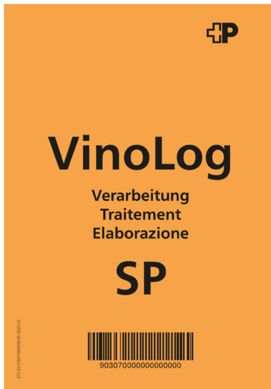
III. Inscription VinoLog pour le traitement dans les centres colis

Les RX / Pal doivent en outre être identifiés avec une fiche spécifique. Fiche RX VinoLog traitement SP: form. 211.25 (exemple: voir illustration).