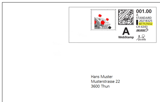
Illustration 1 + 2: Ce WebStamp présentant l'ID d'affranchissement 87757032 a été utilisé à deux reprises pour différents envois alors qu'il n'a été payé qu'une seule fois.