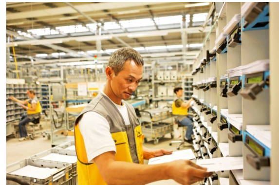
Mercato della comunicazione