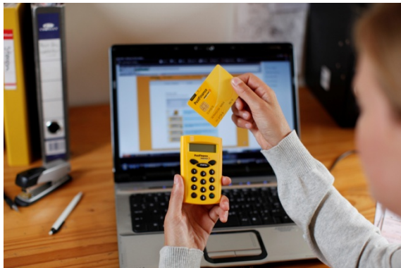
Mercato finanziario retail