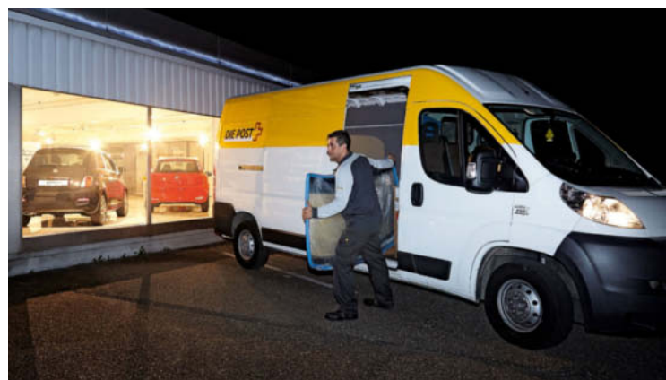
Swiss-Express «Innight» Automotive consegna pezzi di ricambio direttamente in officina prima dell'inizio della giornata lavorativa.

Già prima dell'alba il collaboratore «Innight» passa all'officina, apre e deposita i pezzi di ricambio in un luogo facilmente accessibile davanti alla piattaforma elevatrice. Alle 7.00 i meccanici iniziano la loro giornata. Suddividono i pezzi di ricambio ricevuti e si mettono al lavoro.