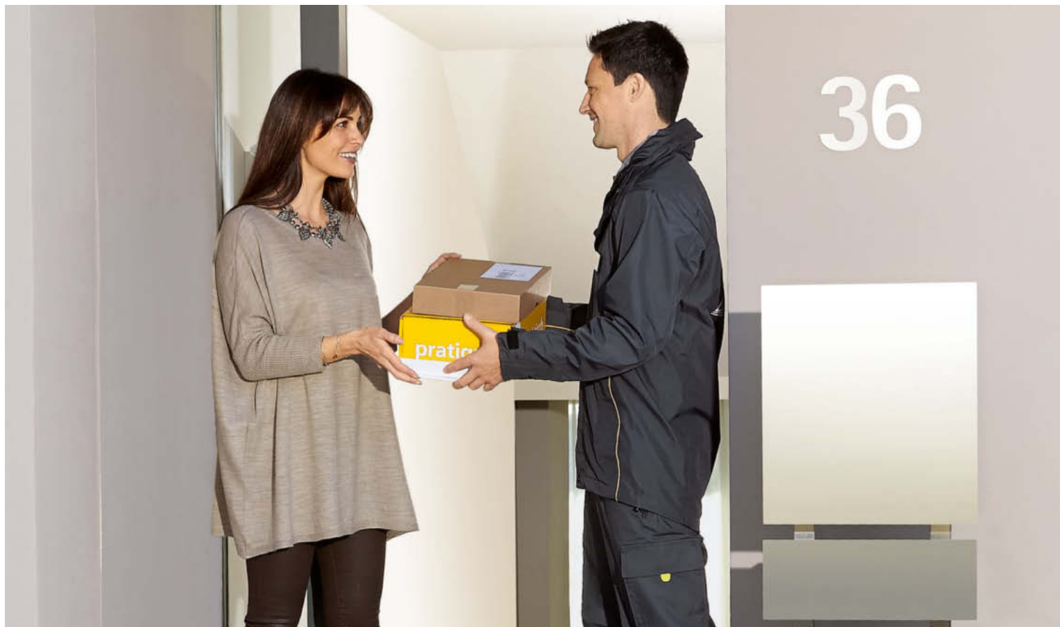
Felici di rivederla! Il fattorino prende in consegna gli invii di ritorno direttamente a casa.

pick@home offre ai vostri clienti la massima comodità: la Posta prende in consegna gli invii di ritorno direttamente a casa loro. Ora potete integrare in tutta semplicità il servizio di presa in consegna nel vostro shop online.