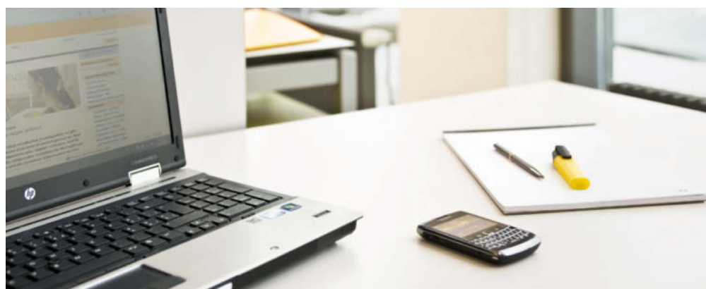
Bastano pochi clic e il gioco è fatto: impostazione efficiente degli invii con My Post Business

Grazie a un accesso protetto in My Post Business accedete ai vostri dati. Anziché doverli registrare ogni volta ex novo per una spedizione, salvate i