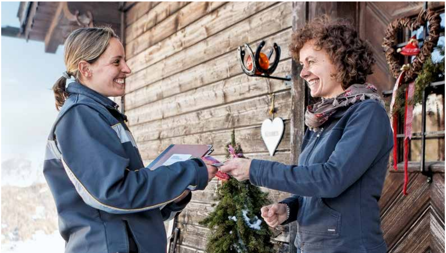
Im direkten Kontakt mit ihren Kundinnen und Kunden erzielt die Post Bestnoten.

2014 hat der Empfängerkundenindex der Post 91 von 100 möglichen Punkten erreicht. Auch bei schwierigen Bedingungen – zum Beispiel schneebedeckten Strassen – werden die Zusteller als zuverlässig und freundlich wahrgenommen. Das freut nicht zuletzt die Absenderkunden, denn von einem Lächeln begleitet kommen ihre Botschaften noch besser an. ■ ls