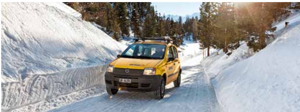
Liefert sehr schnell nach überall: der Swiss-Kurier.

Ob am 24. Dezember oder kurz vor Jahresbeginn: Der Swiss-Kurier holt dringende Sendungen bei Ihnen ab und stellt sie unverzüglich den Empfängern zu.