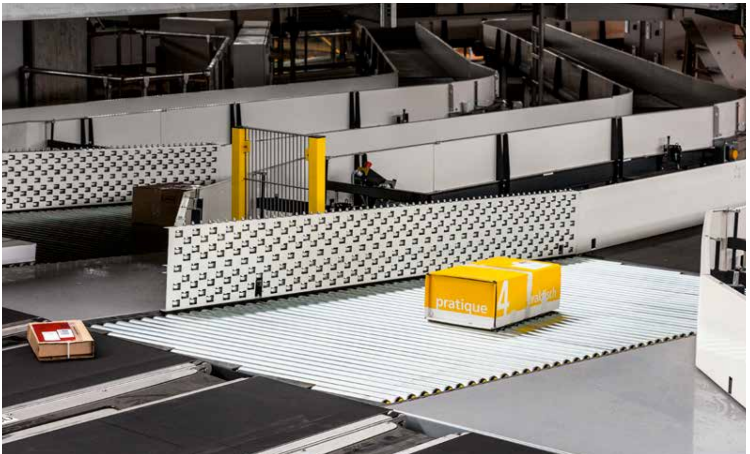
Meistert 25 000 Pakete pro Stunde: die ausgebauten Sortieranlage in Härkingen.

Auch das Paketzentrum Frauenfeld rüstet auf. Nach demselben «Doppeldecker-Prinzip» wie im Zentrum Härkingen erhält es zusätzliche Sortierbänder. Die neue Sortieranlage erstreckt sich über eine Länge von 230 Metern. Begonnen haben die Ausbauarbeiten im September dieses Jahres, die Inbetriebnahme der erweiterten Gesamtanlage ist für Sommer 2015 vorgesehen. Mit dem Ausbau ihrer Anlagen in Härkingen und Frauenfeld erhöht die Post die Leistung ihrer Paketsortieranlagen um rund ein Viertel. Ob und wie sie ihr drittes Paketzentrum in Dailen erweiteren wird, prüft sie derzeit im Rahmen einer Machbarkeitsstudie. So oder so: Die Post ist für die Zukunft bestens gerüstet. Viele Pakete sind willkommen. Sehr viele sogar. ■ an