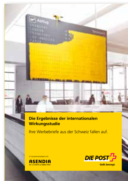
Wissen, was wirkt: die Studienresultate.

www.post.ch/directmarketing-international